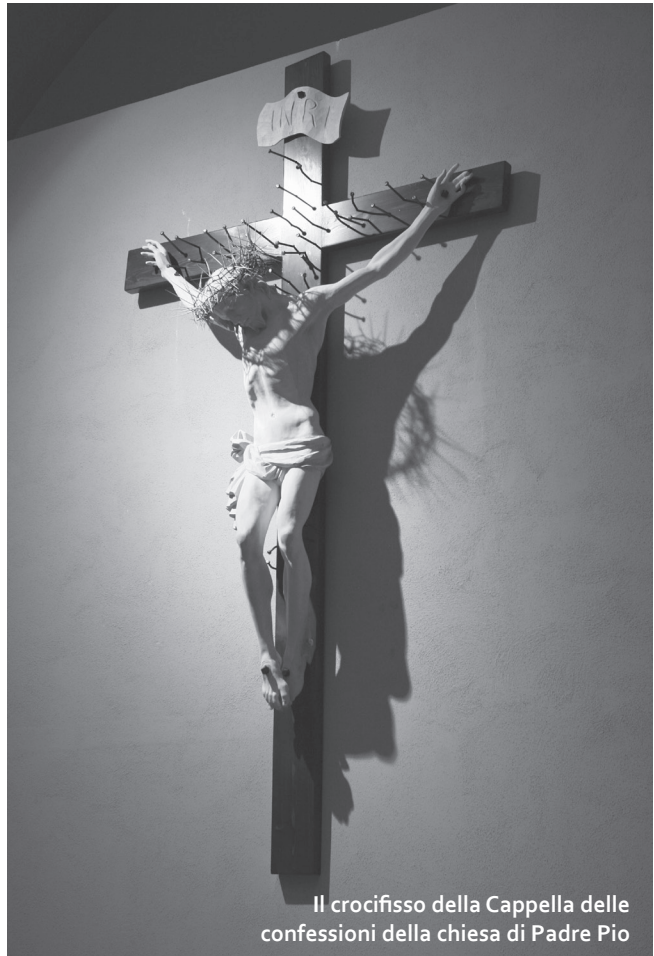
Il crocifisso della Cappella delle confessioni della chiesa di Padre Pio

Contro una sorta di "anestesia spirituale" che rende ciechi e indifferenti alle sofferenze altrui, nel confronto con una cultura che sembra aver smarrito il senso del bene e del male, Benedetto XVI ricorda che il bene esiste e vince, che il bene «è ciò che suscita, protegge e promuove la vita, la fraternità e la comunione»; il bene è interessarsi alle necessità dell'altro, è desiderare che anch'egli si apra alla logica dell'amore e della condivisione e abbandoni strade di perdizione, di egoismo e di morte spirituale. Sono spesso la ricchezza materiale e la sazietà,