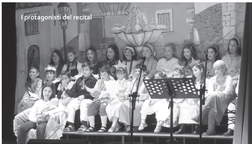
I protagonisti del recital

La storia si svolge ad Assisi e ha per protagonisti tre fratelli. Un giorno questi ragazzi si allontanano da ca-