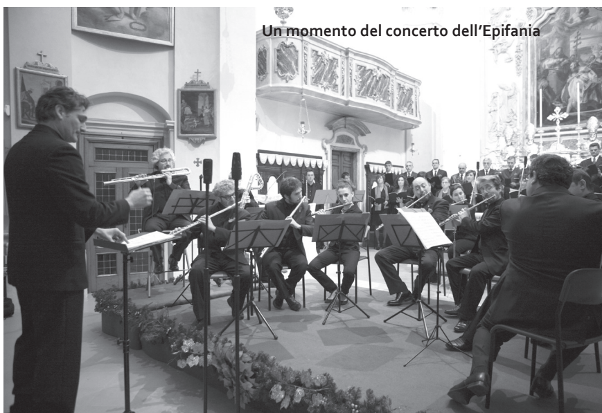
Un momento del concerto dell'Epifania

L'avvio con un pezzo dal Salomon di Händel, poi il corale «Jesus bleibet meine Freude» di Bach per coro e orchestra, il «Nisi Dominus» di Vivaldi, l'«Ave Verum» di Mozart per coro e orchestra, lo struggente «Erbarne dich» di Bach dalla Passione secondo Matteo per contralto e orchestra; poi ancora Mozart con «Laudate Dominum» per contralto, coro e orchestra, l'Intermezzo della Cavalleria rusticana di Mascagni, Rossini con la Sinfonia