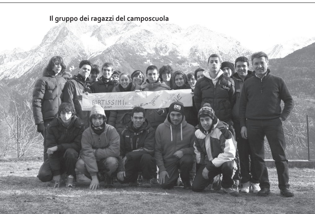
Il gruppo dei ragazzi del camposcuola

Dal 2 al 5 gennaio un bel gruppo di adolescenti con alcuni animatori ha vissuto a Loritto in Valcamonica un'intensa esperienza di amicizia e condivisione.