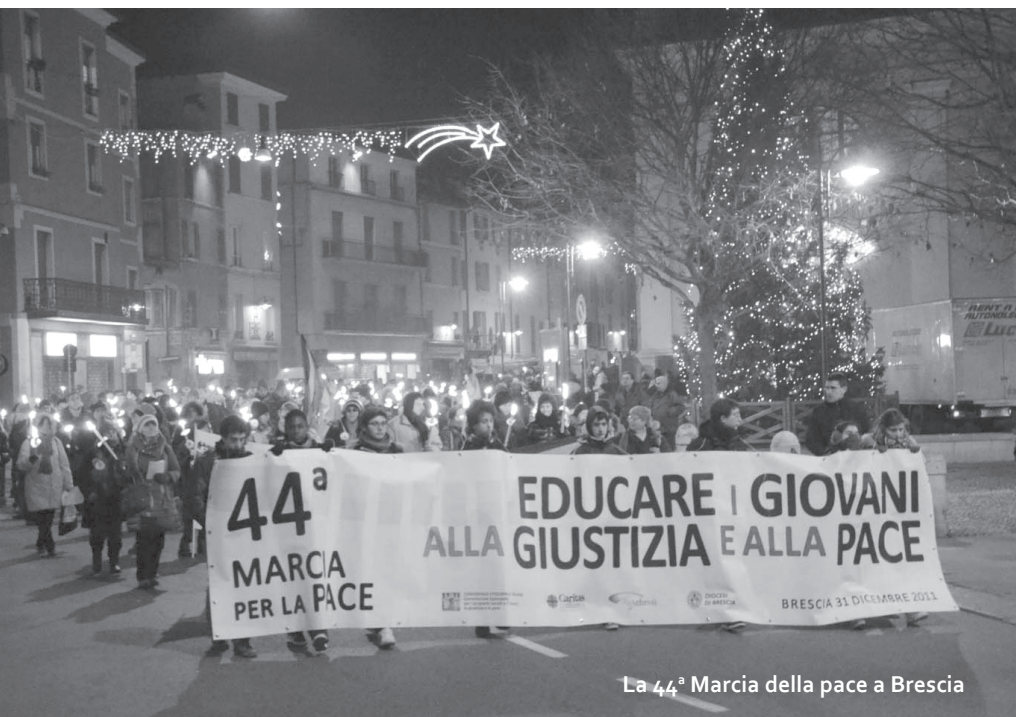
La 44ª Marcia della pace a Brescia