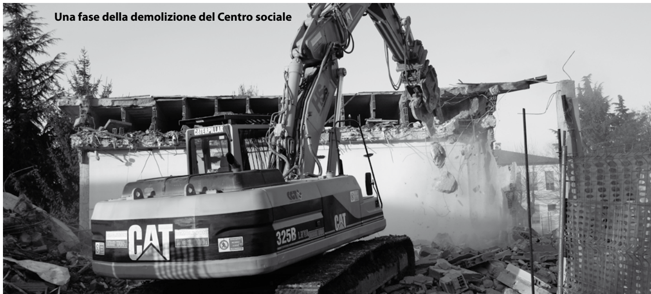
Una fase della demolizione del Centro sociale